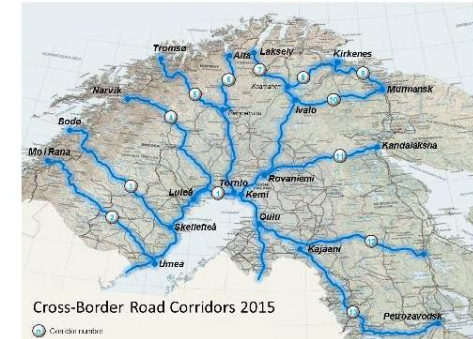
Cross-Border Road Corridors 2015

PART II of this report presents maps and detailed descriptions of the road corridors shown in the general map below.