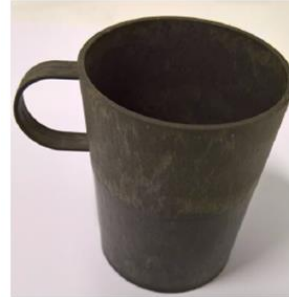
Kuva 17. Komposiittimateriaalista tehty tuote värjättyinä