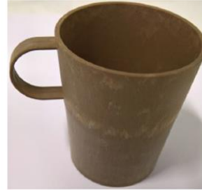
Kuva 16. Komposiittimateriaalista ruiskuvalamalla tehty tuote