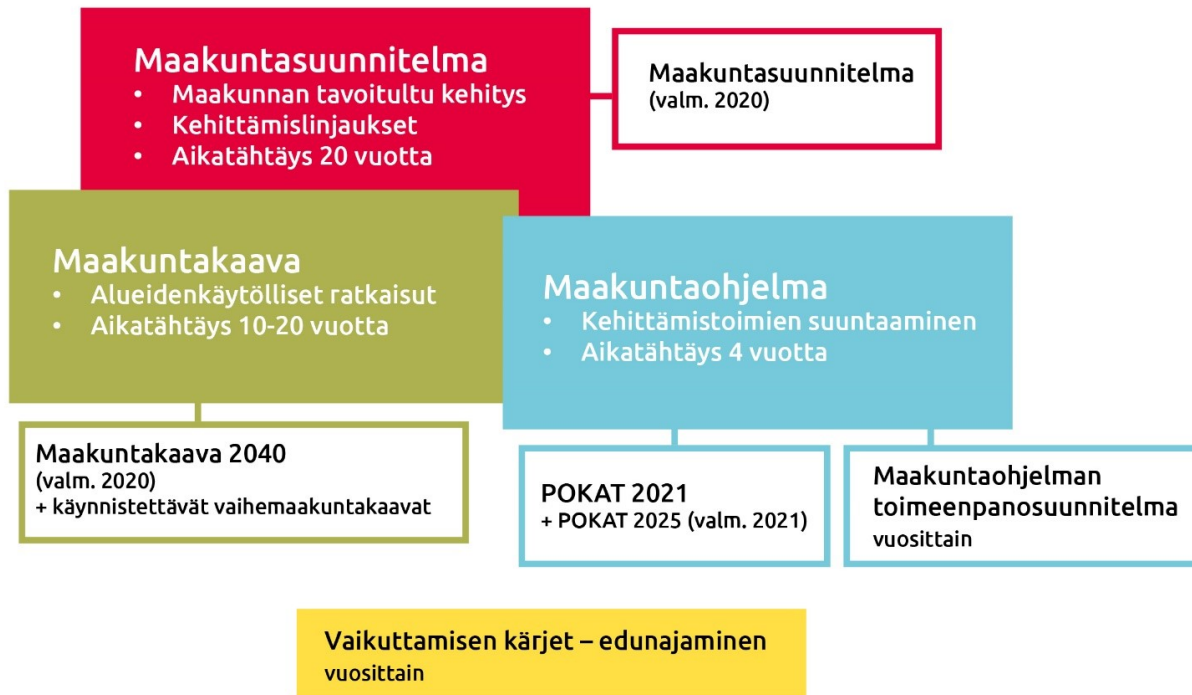
Kuva 3. Maakunnan suunnittelujärjestelmä

Maakuntaohjelma on lakisääteinen aluekehitysohjelma, joka ohjaa alueen kehittämistä. Siinä esitetään maakunnan erityispiirteisiin ja mahdollisuuksiin perustuvat alueen kehittämisen tavoitteet. Lähtökohtana on kansalaisten hyvän elämän ja yritysten menestyksen edellytysten parantaminen luonnon kanssa sopusoinnussa. Maakuntaohjelmaa toteuttavat kaikki pohjoiskarjalaiset toimijat omista lähtökohdistaan; viranomaiset, kunnat, yritykset, järjestöt ja yksittäiset asukkaat. Viranomaisten tulee ottaa toiminnassaan huomioon maakuntaohjelma ja sen toimeenpanosuunnitelma, edistää niiden toteuttamista ja arvioida toimenpiteidensä vaikutuksia alueen kehitykseen. Tämä perustuu lakiin alueiden kehittämisestä ja Euroopan unionin alue- ja rakennepolitiikan toimeenpanosta 756/2021 § 26.