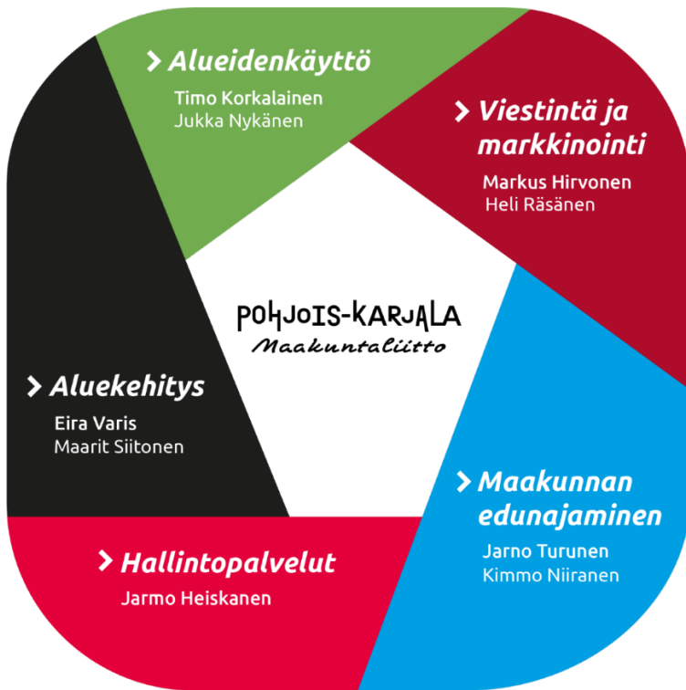
Kuva 1. Pohjois-Karjalan maakuntaliiton organisaatiokaavio

Maakuntaliiton toiminnan ohjaus ja tulostavoitteiden määrittely sekä niiden toteutumisen arviointi tehdään yksiköittäin toiminta- ja talousarviosuunnitelmaan. Henkilöstön pääasialliset tehtävät määritellään maakuntajohtajan vuosittain tai tarvittaessa muulloinkin hyväksymissä tehtäväkuvauksissa.