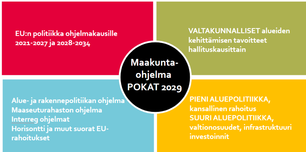
Kuva 2: Maakuntaohjelman rahoitus