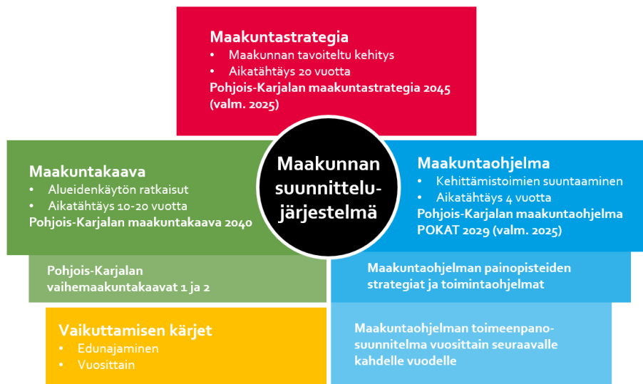
Kuva 1: Maakunnan suunnittelujärjestelmä

Maakuntaohjelman laadintaa ohjaa laki alueiden kehittämisestä ja Euroopan unionin alue- ja rakennepolitiikan toimeenpanosta 756/2021. Sen mukaisesti maakunnan liitto laatii maakunnan pitkän aikavälin strategiaan linjauksiin perustuvan maakuntaohjelman, jossa tarkennetaan maakunnan aluekehittämiseen liittyviä tavoitteita ja niiden toimeenpanoa. Maakuntaohjelmassa otetaan huomioon aluekehittämisspätöksen painopisteet. Maakuntaohjelmaan sisältyy tai sen yhteydessä laaditaan maakunnan älykkään erikoistumisen strategia. Maakuntaohjelma valmistellaan yhteistyössä kuntien, muiden viranomaisten sekä alueiden kehittämiseen osallistuvien yhteisöjen ja järjestöjen sekä muiden tahojen kanssa. Lapin maakunnassa saamelaiskulttuuria koskevan osan valmistelee saamelaiskäräjät. Maakuntaohjelman hyväksyy maakuntavaltuusto valtuustokausittain. Maakuntaohjelmaa voidaan tarkistaa tarvittaessa. Valtioneuvoston asetuksella voidaan antaa tarkempia säännöksiä maakuntaohjelman sisällön rakenteesta, ohjelman valmistelusta sekä ohjelman valmistelun aikataulusta.