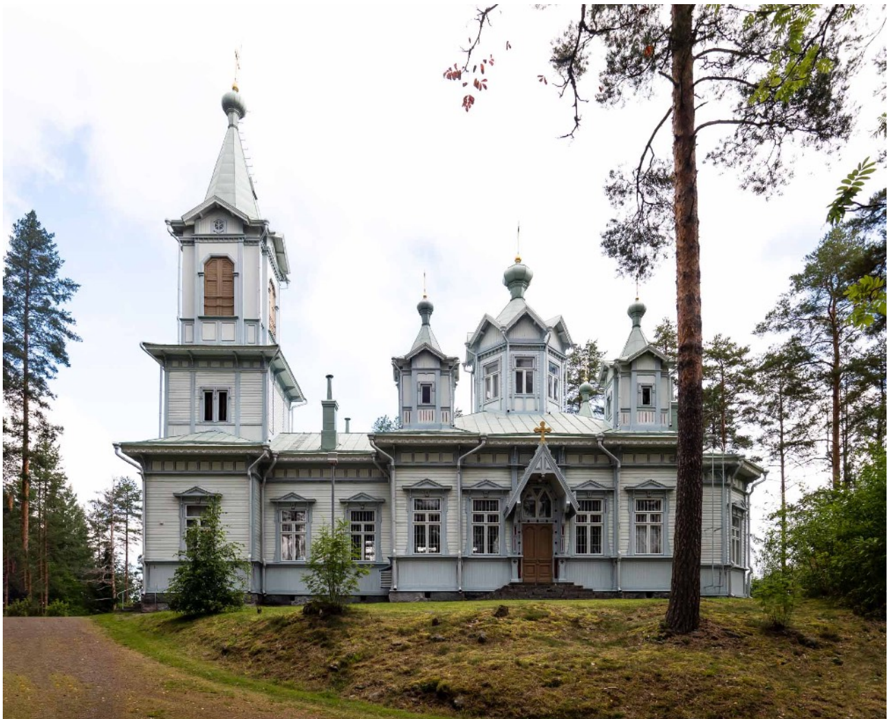
Viinjärven ortodoksinen kirkko